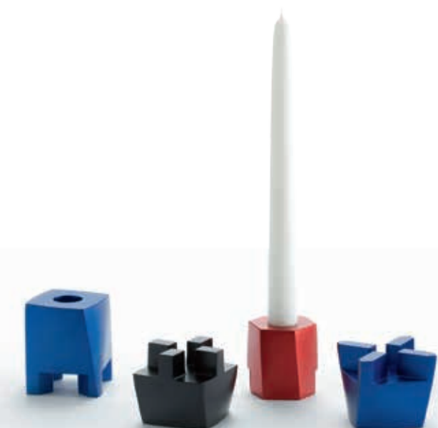
Seok Young Kim

Führungen für Gruppen nach vorheriger Anmeldung Dauer: ca. 1 Stunde Eintritt inkl. Führung 30 €